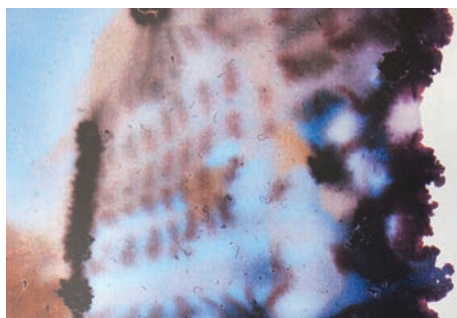
Prix Lacritique.org 2017 : Catherine Aznar , Photomatière NY12 [détail], 2016, impression directe sur aluminium, 180 x 110 cm © Catherine Aznar, Adagp