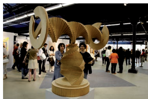
61 e Salon Réalités Nouvelles en 2007 au Parc Floral. Au premier plan, sculpture de Kano