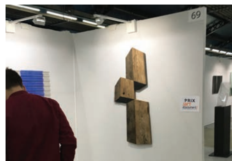
Prix Art Absolument 2017 : Antonius Driessens , Cube décalé , 2017, assemblage bois vieilli et bois brûlé, 150 x 66 x 3 cm © Photo : O. Gaulon © Adagp