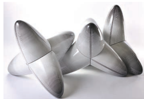
Prix Artension 2017 : Vincent de Monpezat , Tétrapodes cinétiques , 2016, résine, mousse PU, film PVC verni, 90 x 90 x 120 cm © V. de Monpezat