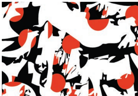
Prix Art Absolument 2014 : Carol-Ann Braun , GOBO 1 [détail], 2014, collage numérique, 50 x 50 cm © Carol-Ann Braun, Adagp