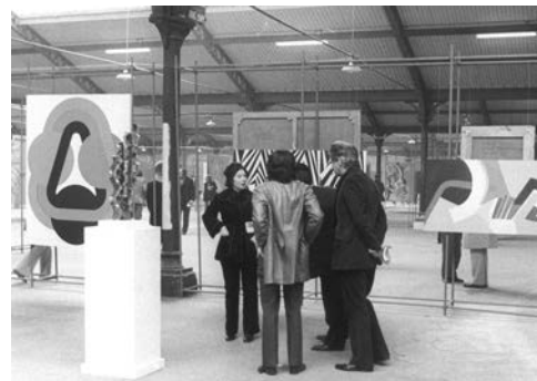
27 e Salon Réalités Nouvelles en 1973 au Parc Floral.