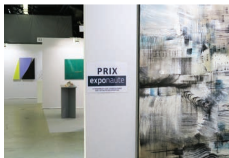
Prix Exponaute 2016 : Bruno Keip , Paysage rythmique [détail], 2016, technique mixte, 190 x 100 cm