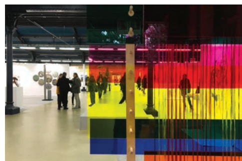
71 e Salon Réalités Nouvelles en 2017 au Parc Floral. Au premier plan, détail de la sculpture Prismes d'Elliott Causse et Kenia Almaraz Murillo