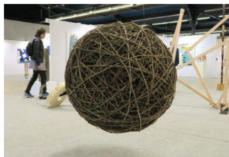
Prix L'Officiel Galeries & Musées 2016 : Sibylle Besançon , Pelote , 2016, ronces, 90 x 90 x 90 cm © Adagp