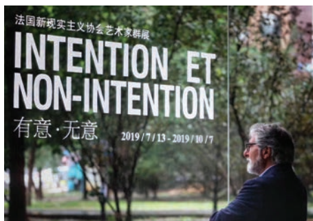
Réalités Nouvelles Hors les Murs en Chine en 2019 à Shenyang, Galerie 1905, 13 juillet 2019