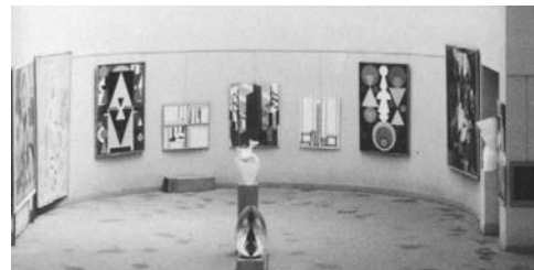
3 e Salon Réalités Nouvelles en 1948 au Palais des Beaux-Arts de la Ville de Paris. Au centre, deux tableaux d'Auguste Herbin – Apollon-Dionysos et Lénine-Staline (1948) – encadrant trois tableaux de František Kupka – Série C VIII (1935-1946), Architecture philosophique (1913-1932) et Élévation, Série CIII (1932)

En 2020 , c'est un nouveau défi qui attend ses artistes : trouver de nouvelles formes à l'abstraction, non figurative, non objective, qui combinent l'exigence de la monstration d'œuvres au public dans cette ère de « virtualisation » et la nécessité d'une réponse haptique pour trouver du grain, de la rugosité et de l'aspérité dans un monde à l'esthétique de plus en plus lisse et transparente. C'est ce que propose cette 74 e édition du Salon à l'Espace Communes avec une sélection d'œuvres d'artistes qui répondent à la problématique de l'intitulé ExtrACT comme un arrachement, une résistance généalogique et une source de création toujours vive dans ce contexte de crise économique, sanitaire et esthétique.